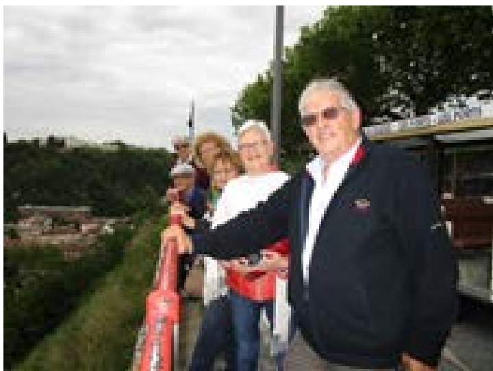
am Samstag, 27.Mai, rund 30 Kahler Besuchten Heidelberg mit dem Bus. Bericht lag vor bei unserer Juli Ausgabe des Infoblatt.